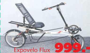
ExpoVelo Flux 999.-