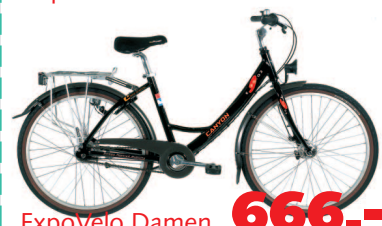
ExpoVelo Damen 666.-