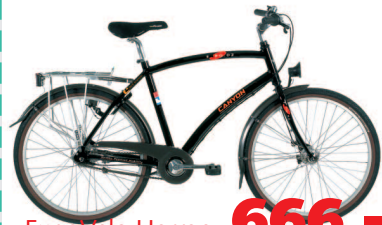
ExpoVelo Herren 666.-

Bitte diesen Talon einsenden an Stiftung Veloland Schweiz, Postfach 8275, 3001 Bern